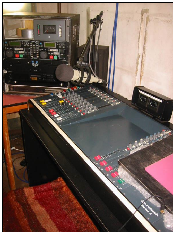
Studiet på Red Sands Radio, som blev anvendt under transmissionerne fra 14.-23. juli med sølle 1 watt. Alligevel blev stationen hørt af SHN i Kousted ved Randers og af BV ved Blåvand.