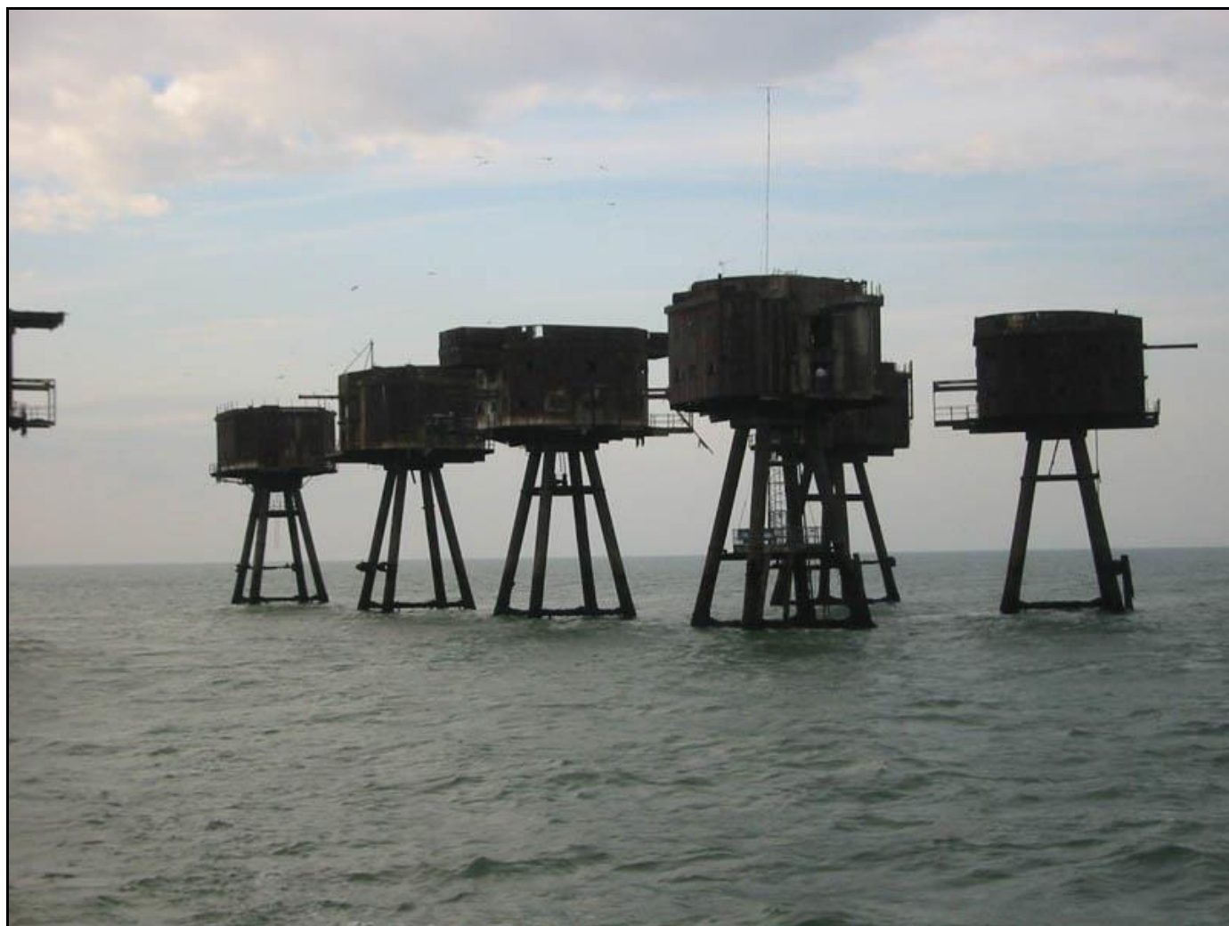
Sådan ser Red Sands Fort ud i dag. Fortet er opført i 1943 under Anden Verdenskrig og skulle være et værn mod fjendtlige angreb. Siden blev de bastioner for offshore-radiostationer.