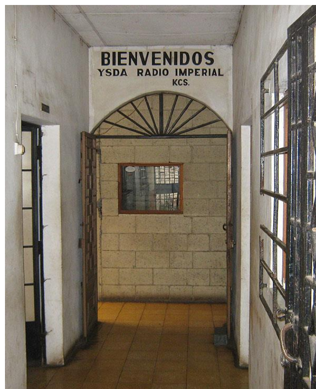
For enden af en lang gang i entréen bydes besøgende velkomne til YSDA Radio Imperial.

Radio Imperial holder til et hus på en af de større udfaldsveje fra Sonsonate. Det er vist vejen til hovedstaden San Salvador. Udefra kan man se et beskedent navneskilt og så en mellembølgemast i baghaven. Jeg kommer uanmeldt, men tager chancen og banker på.